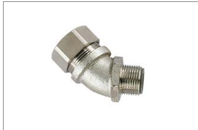
HelaGuard LTS-45FMC 45°-Kompressionsverschraubung.