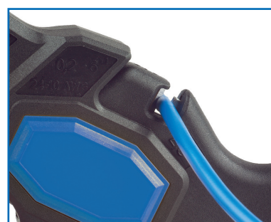
Schneiden: 0,2 - 2,5 mm 2 AWG 24 - 14