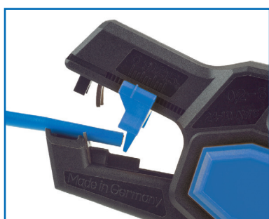
Längenanschlag: 6 - 15 mm