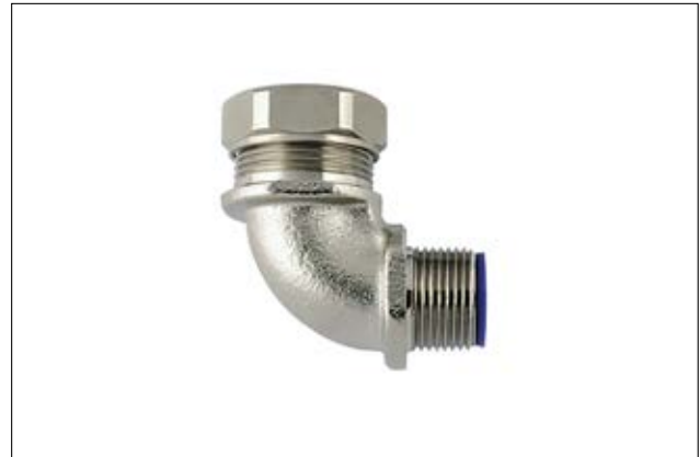
HelaGuard LTS-90FMC 90°-Kompressionsverschraubung.