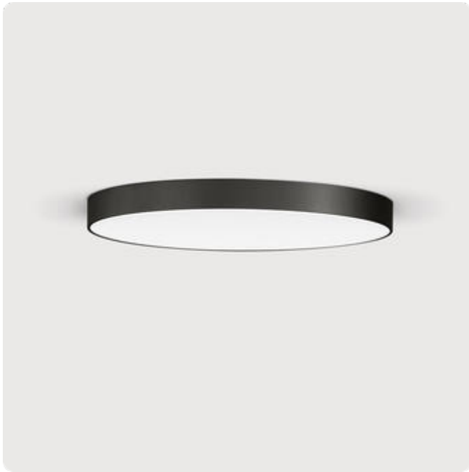
Abbildungen ggf. nur ähnlich, dienen als Orientierung.