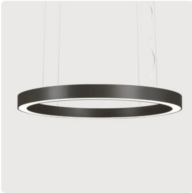
Abbildungen ggf. nur ähnlich, dienen als Orientierung.