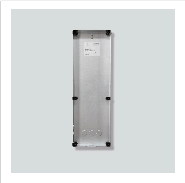
Unterputzgehäuse Siedle Classic GU CL 10-0 210007746-00

Gehäuse für die Unterputzmontage aus feuerverzinktem Stahlblech. Zu jeder Frontplatte muss ein passendes Gehäuse bestellt werden.