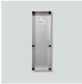
Unterputzgehäuse Siedle Classic GU CL 10-0