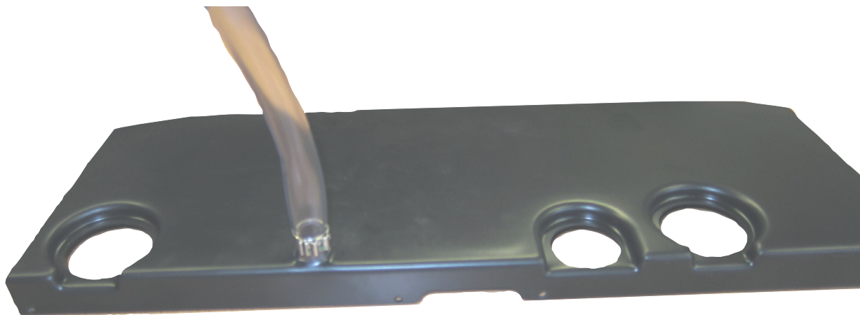
Abb. 2.1: Montage Kondensatschlauch

Vor der eigentlichen Montage der Tropfwanne am HWK 332 sollte der Kondensatschlauch mit der beiliegenden Rohrschelle am Ablaufstutzen montiert werden (siehe Abb. 2.1).