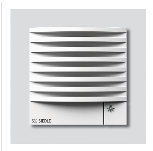
Türlautsprecher-Modul 6+n TLM 611-02 W 200036931-00