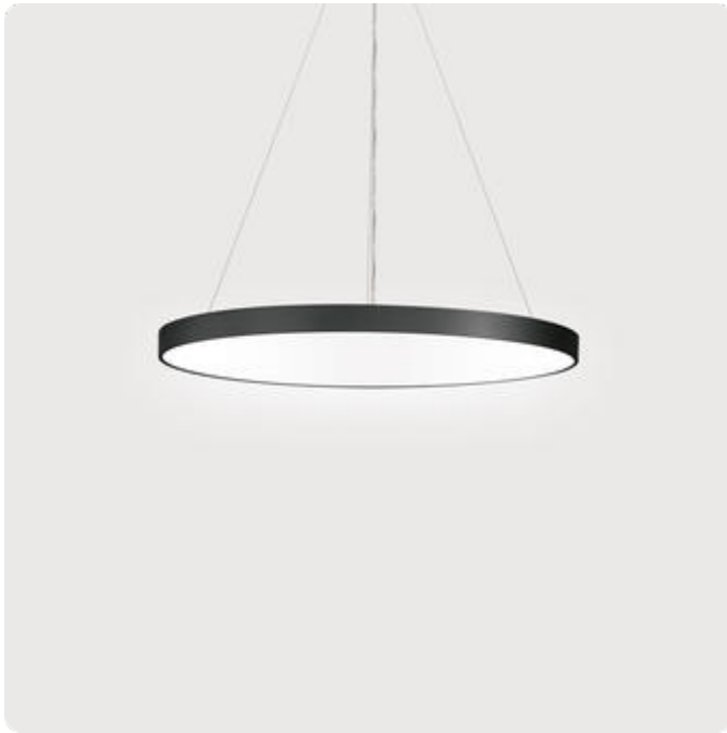
Abbildungen ggf. nur ähnlich, dienen als Orientierung.