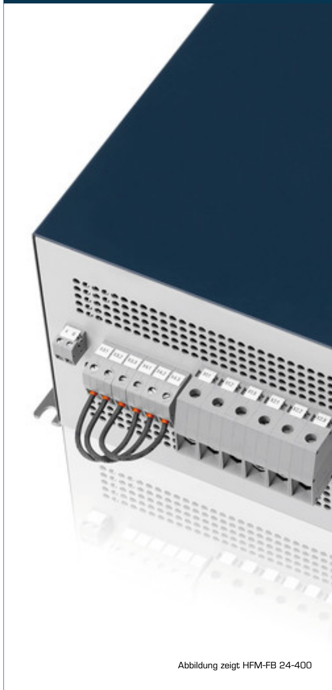
Abbildung zeigt HFM-FB 24-400