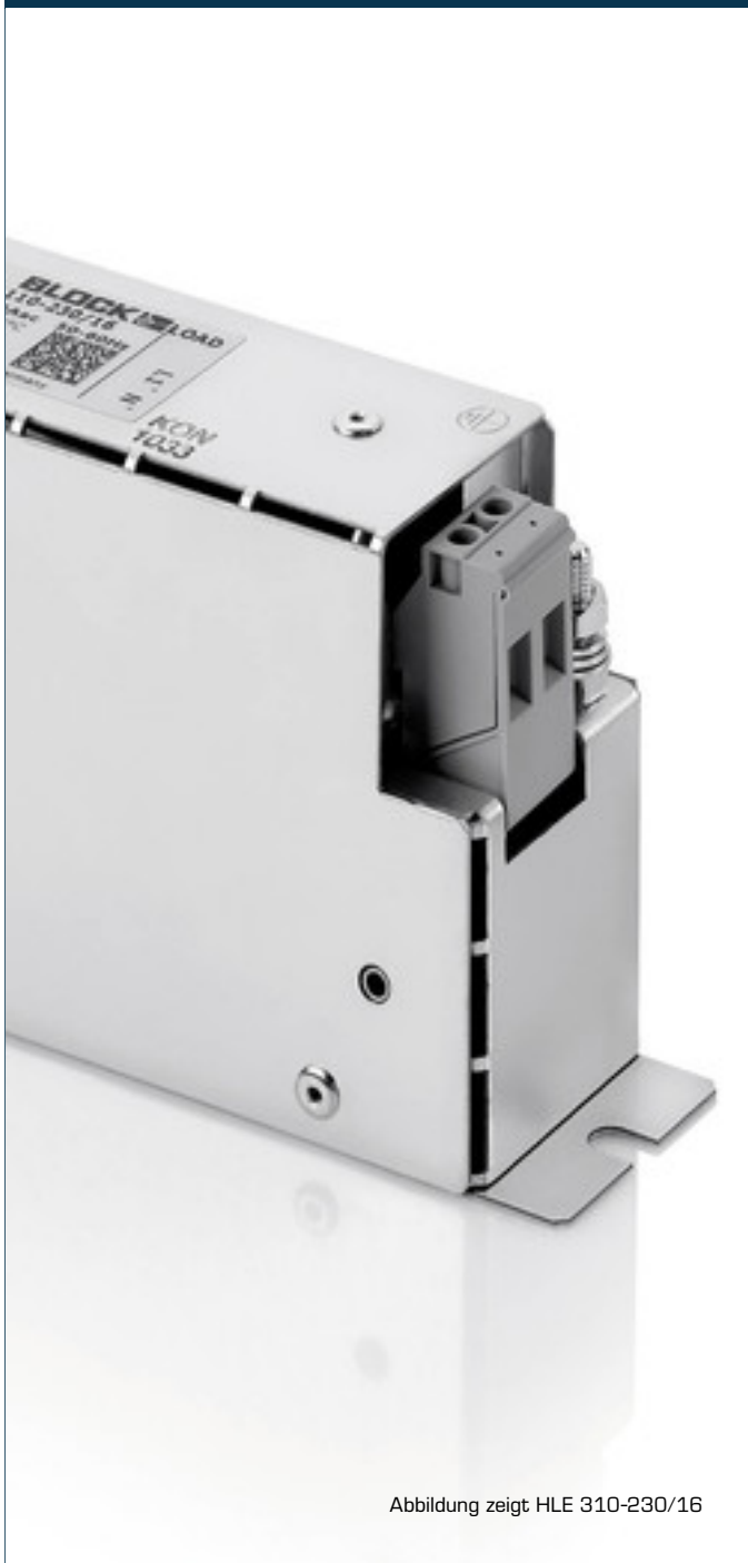
Abbildung zeigt HLE 310-230/16