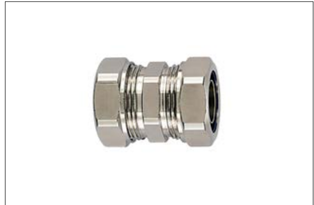
HeliaGuard LTS-LTS Kompressionsverbinder für zwei LTS-Schläuche.