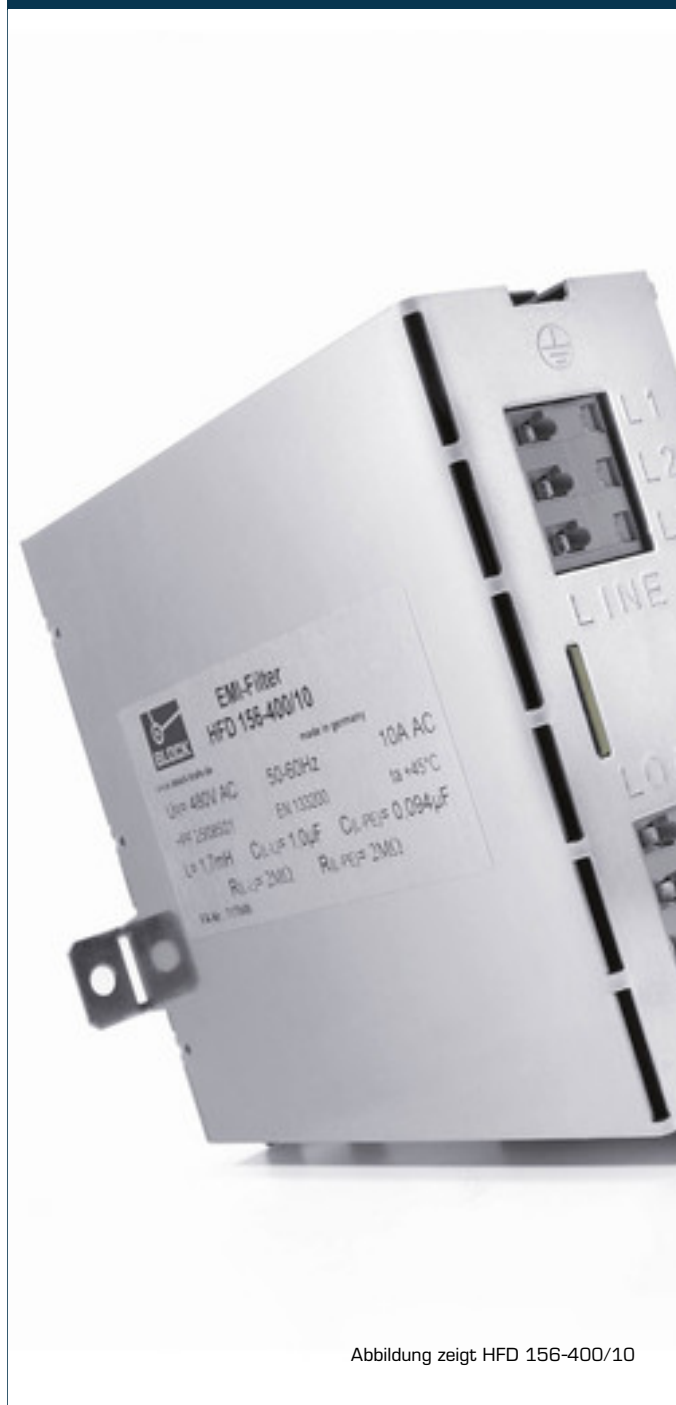
Abbildung zeigt HFD 156-400/10