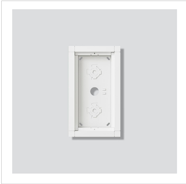
Gehäuse-Aufputz GA 612-2/1-01 W