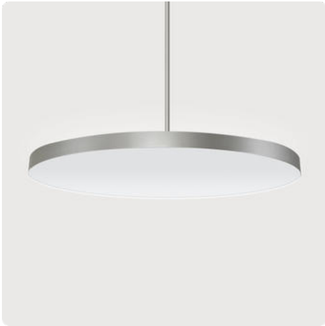
Abbildungen ggf. nur ähnlich, dienen als Orientierung.