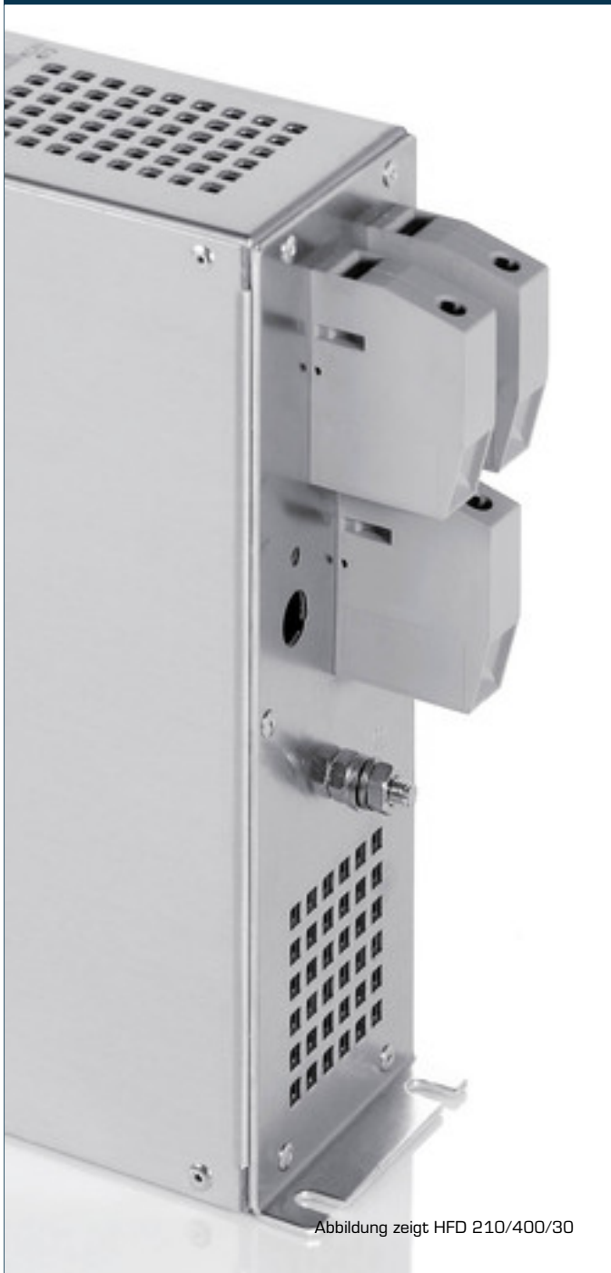
Abbildung zeigt HFD 210/400/30