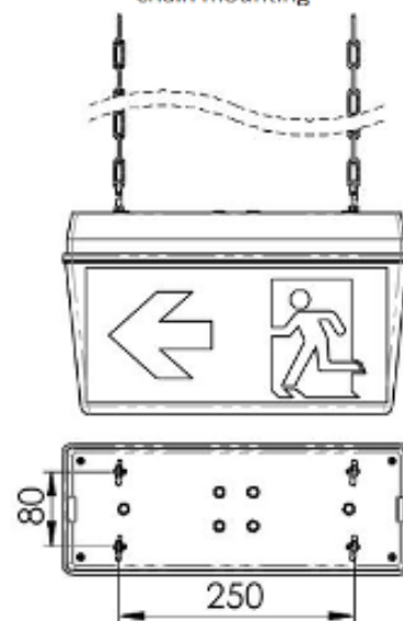
Kettenbefestigung | chain mounting