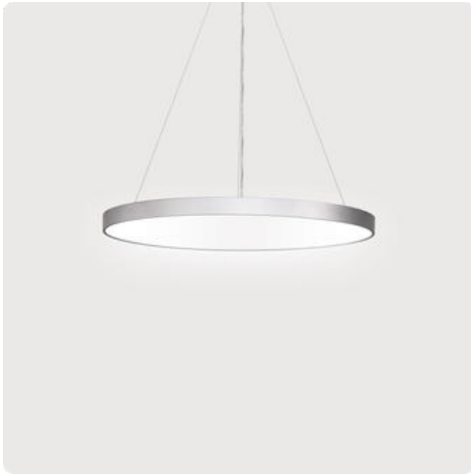
Abbildungen ggf. nur ähnlich, dienen als Orientierung.