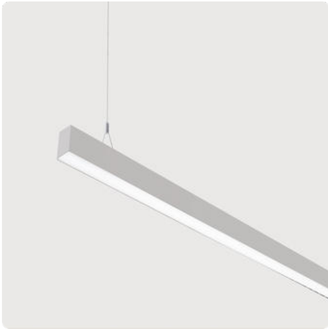
Abbildungen ggf. nur ähnlich, dienen als Orientierung.