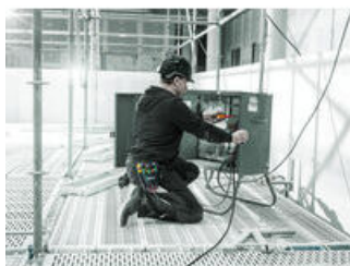
Schraubendrehersätze in Gürteltasche