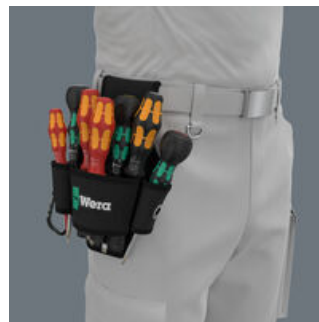
Die Gürtel-Tasche ist aus robustem Material und kann am Gürtel befestigt werden.