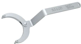
SLS 6G, Gelenkstirnlochschlüssel