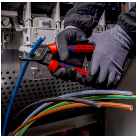
Geschraubtes Gelenk: leichtgängig, präzise, nachstellbar

Technische Änderungen und Irrtümer vorbehalten