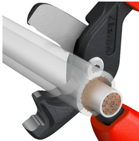
Abgestufte Schneiden und Haltedorn verhindern das Herausrutschen von kleineren und größeren Kabeln