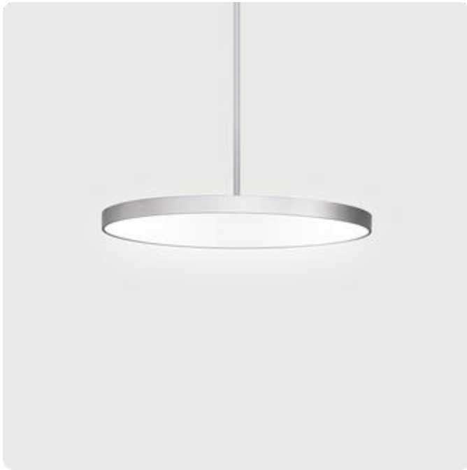
Abbildungen ggf. nur ähnlich, dienen als Orientierung.