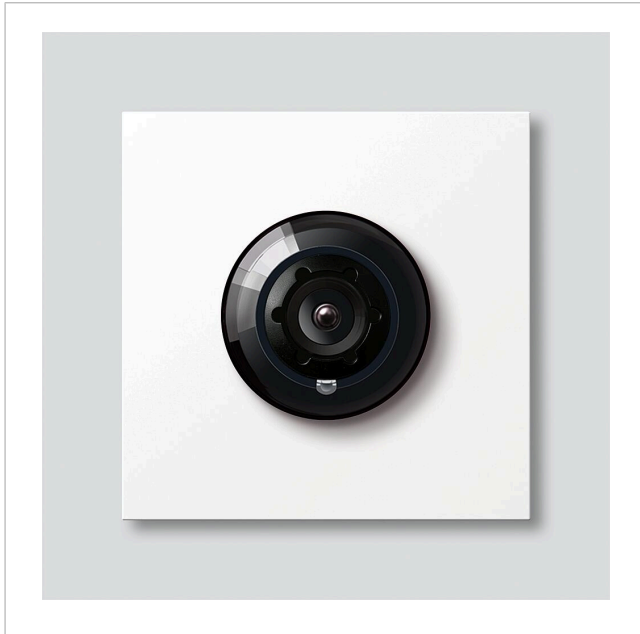
Systemfreie Kamera 130 für Siedle Vario CM 613-03 W 200048280-03