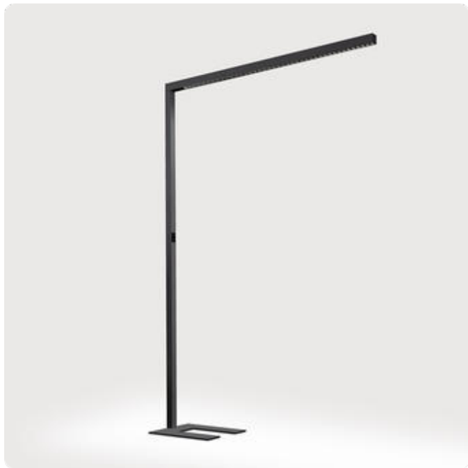
Abbildungen ggf. nur ähnlich, dienen als Orientierung.

Matric-SX. LED. Stehleuchte mit einem Leuchtenkopf, Beleuchtungskörper aus hochwertigem Aluminiumprofil. Oberfläche Jet Black. Lichtcharakteristik: Direkt-/ indirektstrahlend. Farbtemperatur: 3500K (Neutral White). Farbwiedergabeindex (Ra): >80. Lens Louvre: Präzisionslinsen mit Abblendraster für breite, rotationssymmetrische Lichtstärkeverteilung bei gleichzeitig hoher Blendungsbegrenzung. BAP-tauglich für Office-Anwendungen. UGR<=19. Reflektor: Jet Black. Getrennt stufenlose Dimmung der Lichtkammern direkt/indirekt. LxBxH (Leuchtenkopf, rechteckig/Mast). L=1470mm. B=