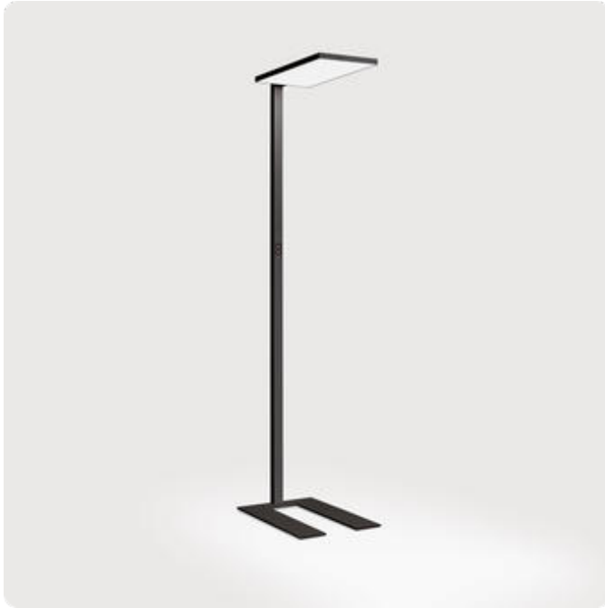
Abbildungen ggf. nur ähnlich, dienen als Orientierung.