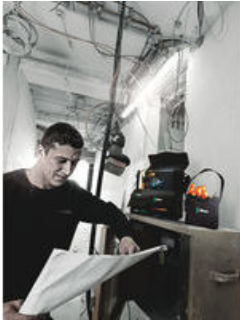
Wera 2go 4 Köcher