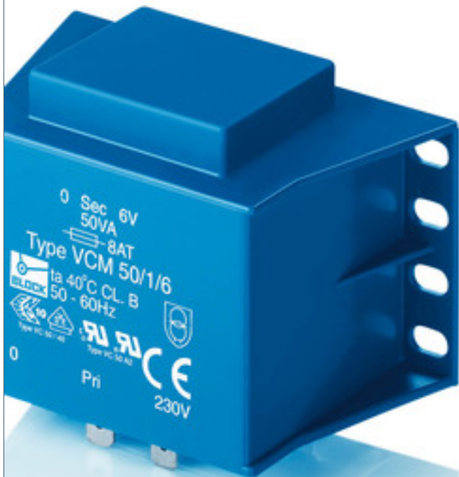
Abbildung zeigt VCM 50/1/6