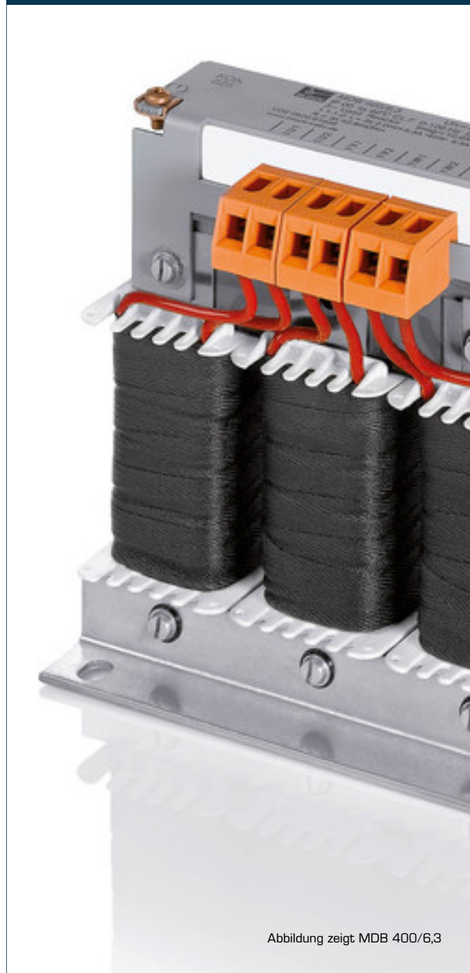
Abbildung zeigt MDB 400/6,3