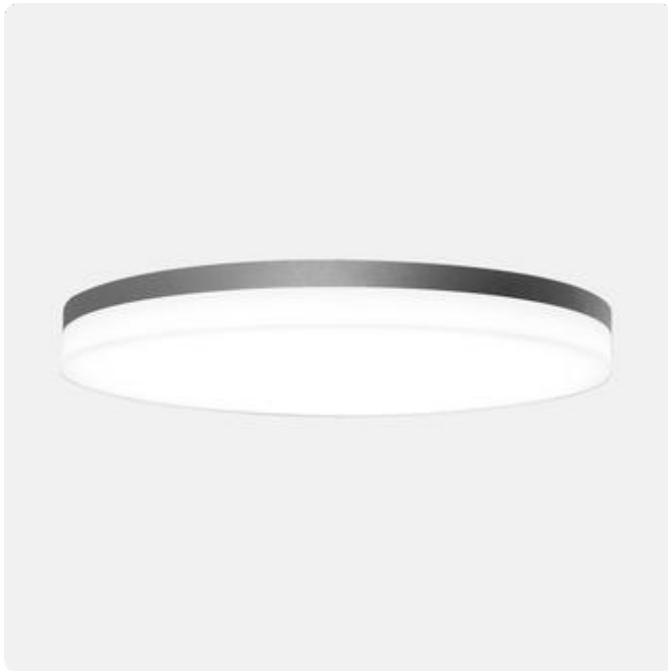
Abbildungen ggf. nur ähnlich, dienen als Orientierung.