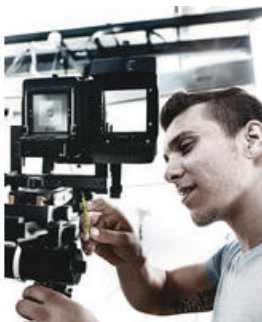
Mit Haltefunktion für Innen TORX® Schrauben