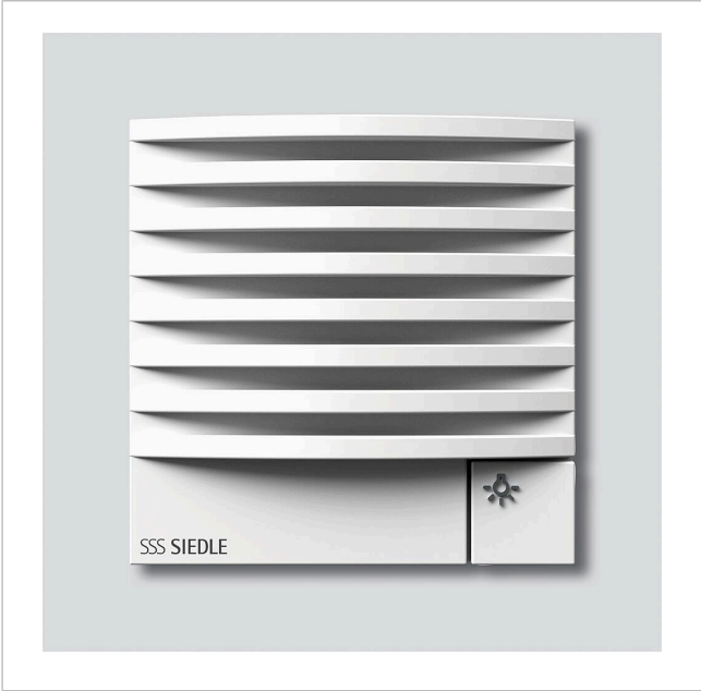
Access-Türlautsprecher-Modul Plus ATLM 671-0 W 210007344-00

Access-Türlautsprecher-Modul Plus für Siedle Vario mit integriertem Lautsprecher und Mikrofon, sowie zusätzlichem Audio-Verstärker und Geräuschfilter.