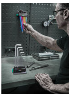
Rack zum Hinstellen auf den Tisch oder zur Befestigung an der Wand