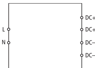
Prinzipialschaltbild PSU DC24 30W