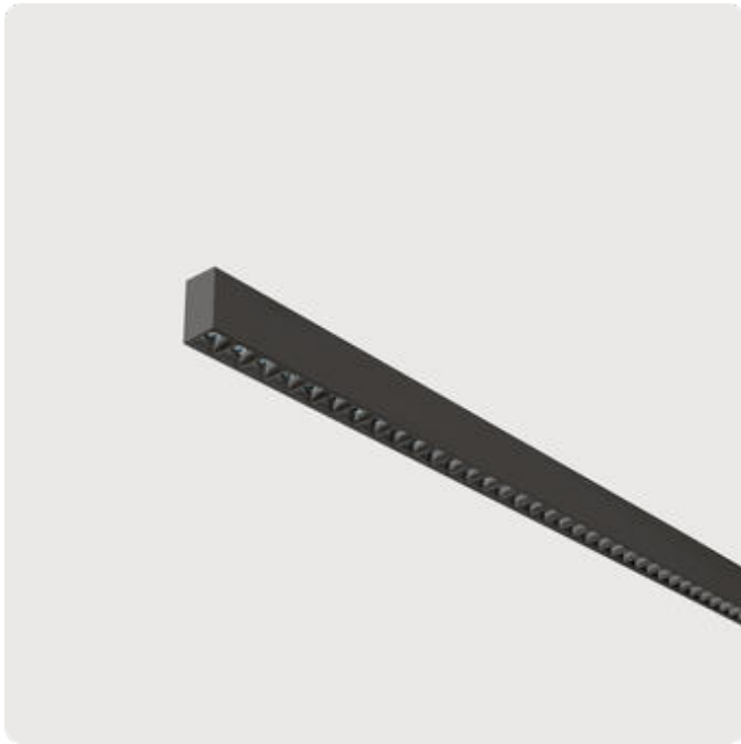
Abbildungen ggf. nur ähnlich, dienen als Orientierung.

Matric-AX. LED. Lichtlinie für Wand- oder Deckenmontage. Beleuchtungskörper aus hochwertigem Aluminiumprofil. Oberfläche Jet Black. Lichtcharakteristik: Rein direktstrahlend. Farbtemperatur: 4000K (Cool White). Farbwiedergabeindex (Ra): >80. Lens Louvre: Präzisionslinsen mit Abblenderaster für breite, rotationssymmetrische Lichtstärkeverteilung bei gleichzeitig hoher Blendungsbegrenzung. BAP-tauglich für Office-Anwendungen. UGR<=19. Reflektor: Jet Black. Einfach