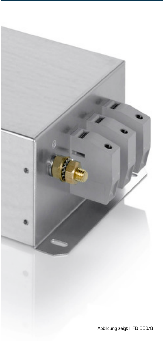
Abbildung zeigt HFD 500/8