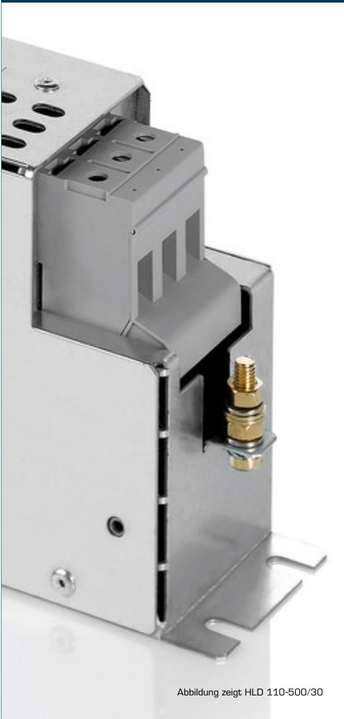
Abbildung zeigt HLD 110-500/30