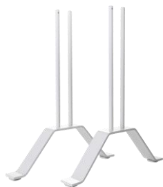
Zubehör: Standfüße VZ-VF-SF