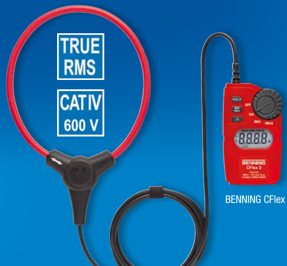
BENNING CFlex 2

duspol@benning.de • Tel.: +49 / (0) 2871 / 93-111