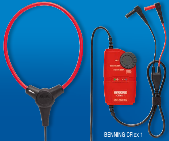
BENNING CFlex 1