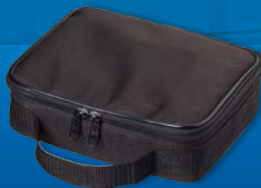
Schutztasche im Lieferumfang