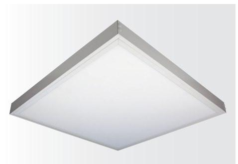
Aufbau-Montagerahmen für LED Panel STEP II, weiß