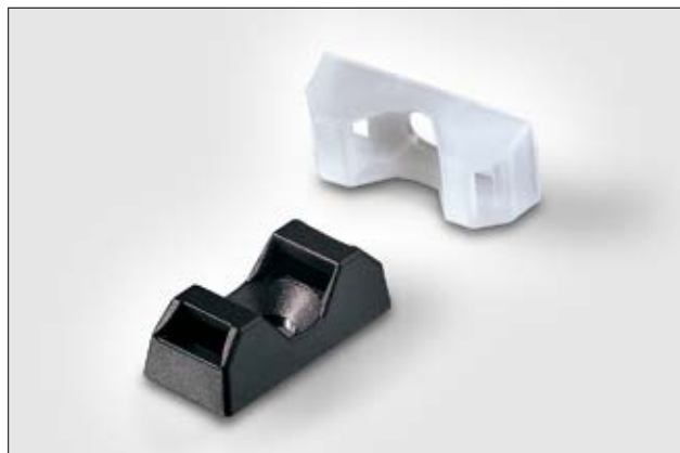
Q-Mount Befestigungssockel CTQM zum Schrauben.