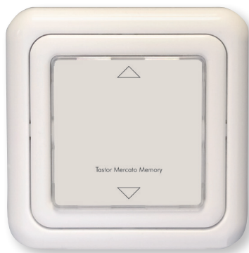
Abb.1: Art. 311500