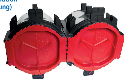
Signaldeckel mit Markierungsborsten separat erhältlich (Art.-Nr. 05106825 / ID-Nr. 057629)