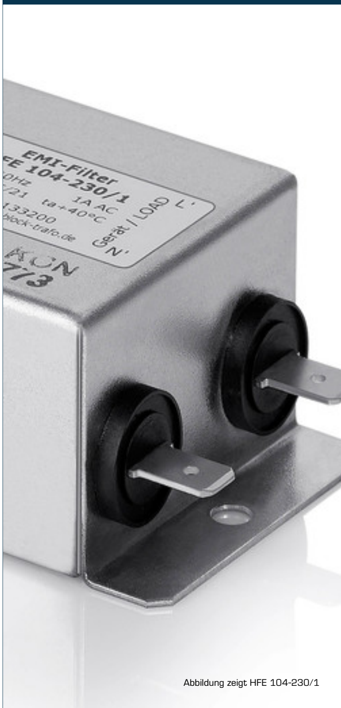
Abbildung zeigt HFE 104-230/1