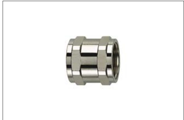
HelaGuard ACP Schlauchverbinder, Messing vernickelt.