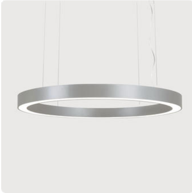
Abbildungen ggf. nur ähnlich, dienen als Orientierung.