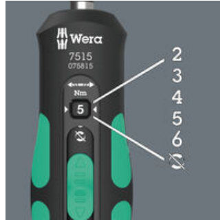
Fünf wählbare Anzugsdrehmomente (2,0; 3,0; 4,0; 5,0; 6,0 Nm) und eine Fest-Stellung (Torque Lock) für unbegrenzte Löse- und Anzugsmomente.