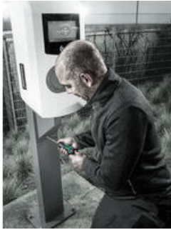
Drehmomentschraubendreher mit Schnelleinstellung