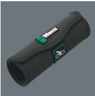
Aufbewahrung und Transport in einer robusten und kompakten textilen Rolltasche. So ist das Werkzeug immer zur Hand.