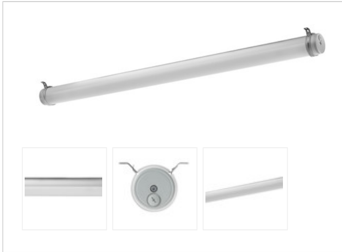
TUBIS N LED