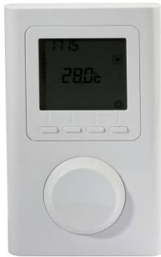
Notwendiges Zubehör: Raumthermostat VTX-SP