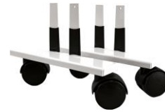
Zubehör: Laufrollen VZ-VF-LR