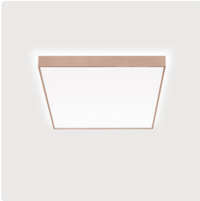
Abbildungen ggf. nur ähnlich, dienen als Orientierung.